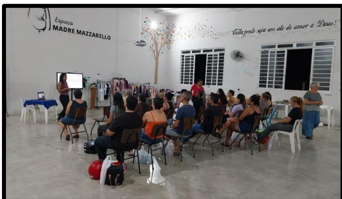
REUNIÃO SOCIOEDUCATIVA – 28/04/2026