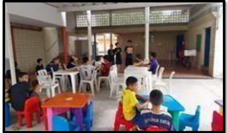
OFICINA DE RODA E CONVERSA / LEITURA – 08/04/2026