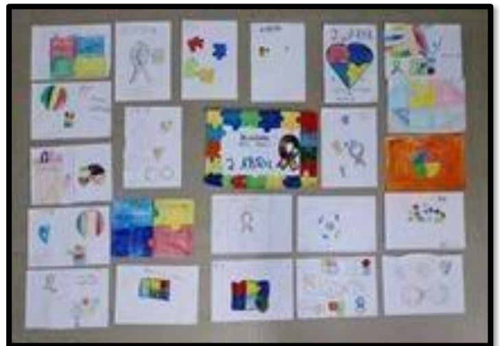
OFICINA DE PARTICIPAÇÃO SOCIAL – 07/04/2026