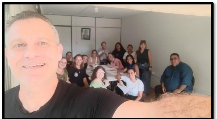
REUNIÃO ORDINÁRIA CMAS – 29/04/2026