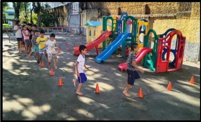
OF. DE ESPORTES – 13/04/2026