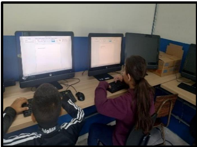
OFICINA DE EDUCOMUNICAÇÃO – 16/04/2026